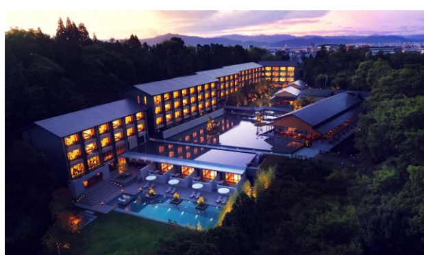
ROKU KYOTO, LXR Hotels &amp; Resorts