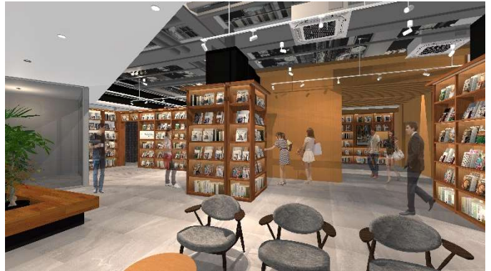
「東急ステイ大阪本町」1F ロビー完成イメージ

また、大型荷物一時保管の「バゲッジポート」を新設し、宿泊者の利便性を向上させるためのサービスを導入します。これにより滞在前後の荷物の煩わしさから解放され、大阪旅行を身軽に満喫することが叶います。