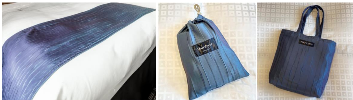
左：旧客室で使用していた「フットスロー」 中・右：アップサイクル後の「ドライヤー袋」と「貸出備品袋」

東急リゾート&ステイ株式会社のSDGsブランド「もりぐらし®」の取り組みの一環として、当ホテルで廃棄予定だったフットスローとボルスタークッションを新たな備品へアップサイクルしました。廃棄をなくしたいというスタッフの想いから皆で知恵を絞り、フットスローは「ドライヤー袋」「貸出備品袋」として、ボルスタークッションは「ホテルスタッフ用のネクストラップ」へ生まれ変わりました。当社では、使える資源を無駄にしない活動を率先し、循環型社会にも貢献していきたいと考えます。