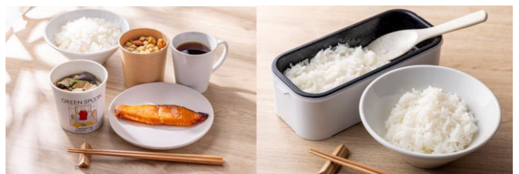
左：豚汁や焼き魚などの和食メニュー例 右：小型炊飯器（貸出）で炊き立てのご飯を味わえます