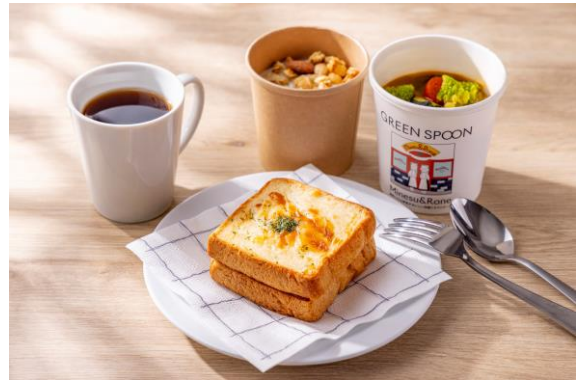
こだわりのパンや具沢山のスープの 洋食メニュー例