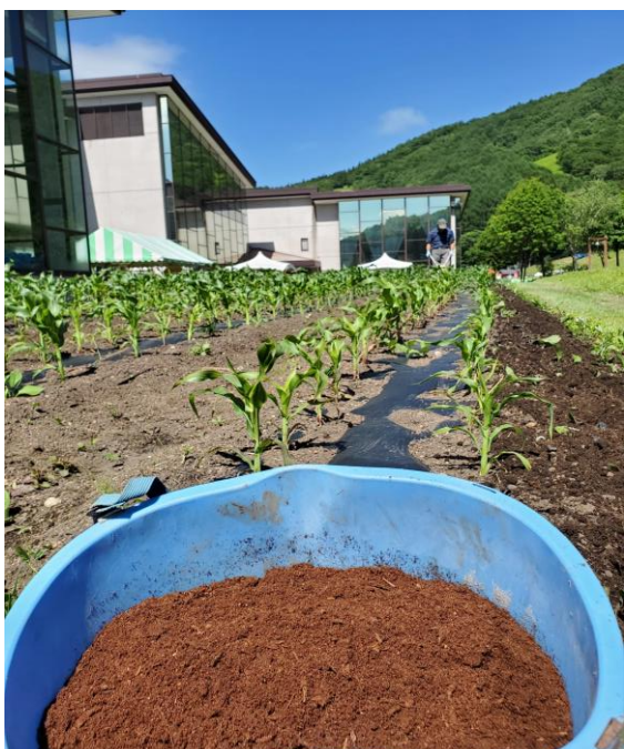
生ごみから作られた肥料

タングラムではサステイナブルな取り組みの一環として、とうもろこし作りに取り組み 3 年目をむかえます。タングラムで発生した食品残渣をタングラム敷地内に設置したコンポストを活用して堆肥化し、とうもろこし畑で肥料として活用する、食の循環の取り組みも開始します。