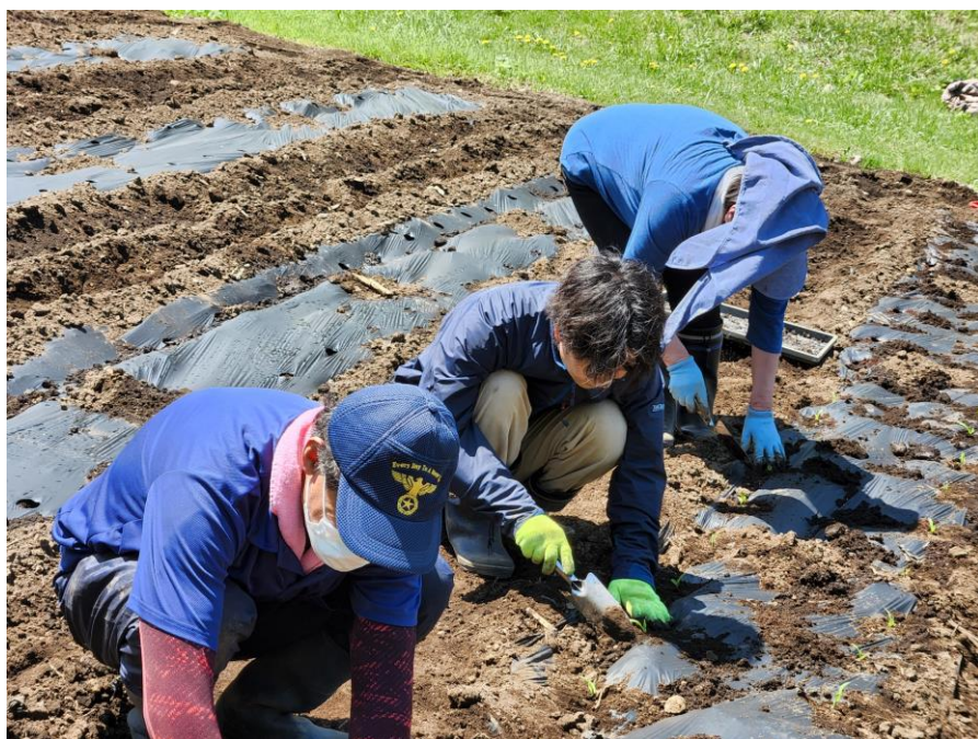
苗植えをするタングラムスタッフと地元農家さん