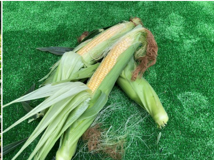
みずみずしいジューシーなとうもろこし