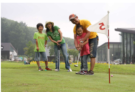
家族で楽しいパターゴルフ