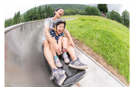
人気のスーパーボブスレー