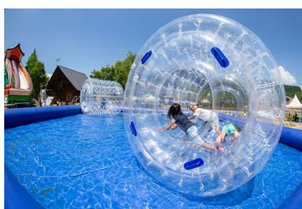
子供がはしゃぐキッズパーク