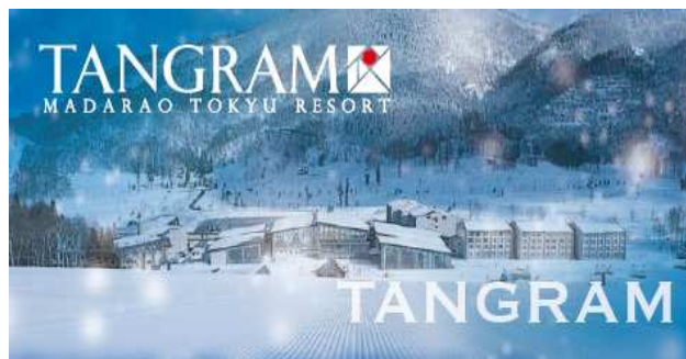
滑る、泊まる、遊ぶがひとつに、「タングラム」