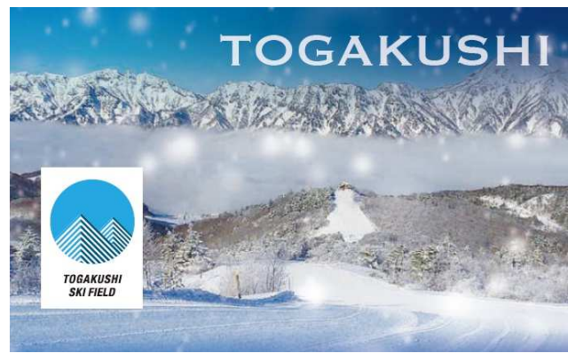
「魔法の粉雪」、基礎スキーヤー・ボーダーの聖地「戸隠」