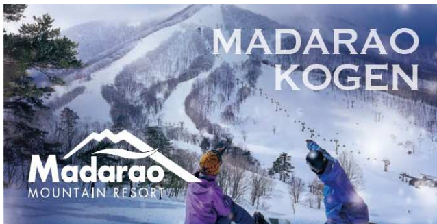
エリア最多のツリーラン、パウダーコース「斑尾」