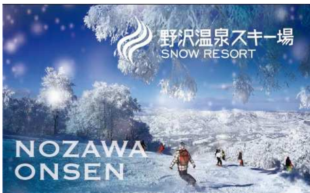
世界的に有名なスノーリゾート「NOZAWA」