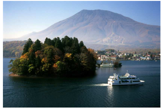
定員 310 名の 大型遊覧船「雅」