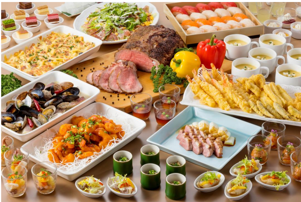
ローストビーフや栃木県ご当地メニューが人気のbuffet