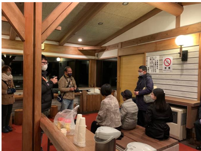
双眼鏡レクチャーの様子