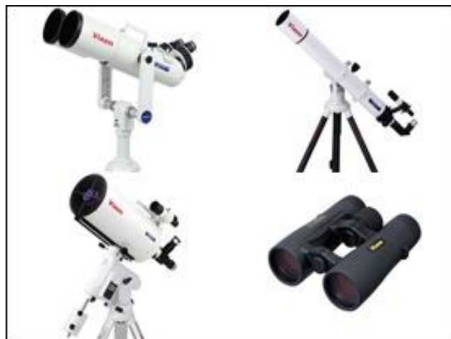
天体望遠鏡・双眼鏡 (Vixen)