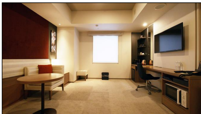
東急ステイ銀座（スーパーアツイン 25㎡）

今回、東京、北海道、近畿エリアの一部店舗を対象に実施し、普段の職場と異なる場所で、休暇を兼ねてリモートワークを行うワーケーションとしてご活用いただくシーンも想定しております。そのため、各種プランには、日中の客室利用のみのデユースプランだけでなく、アーリーチェックインプランなども一部ご用意しております。「東急ステイ」では、洗濯乾燥機・電子レンジ・ミニキッチンといった中長期滞在に便利な設備を多くの客室内に設置し、他社ホテルと比較しても広めの客室をご提供、より快適にお過ごしいただける環境を整備しております。