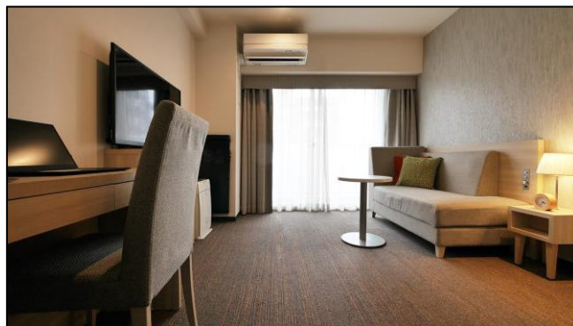
東急ステイ四谷（シングルCタイプ 20㎡）