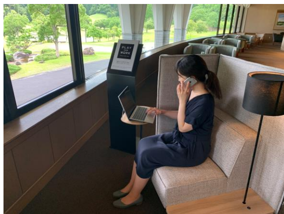
大多喜城ゴルフ倶楽部 ラウンジ席