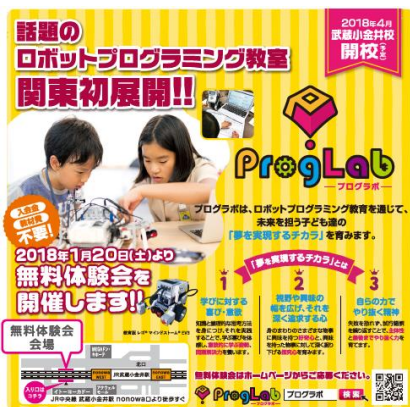
ポスターイメージ

尚、1月20日より武蔵小金井にて無料体験会を実施します。来春4月開校予定の武蔵小金井校については詳細が決まり次第ご案内します。