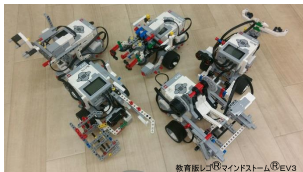
教育版レゴ® マインドストーム® EV3 生徒たちが制作したロボット

教育版レゴ® マインドストーム® EV3 を用いて、 モーターや各種センサーを使ってロボットを組み立て、 ビジュアルアイコンを使ったソフトウェアでプログラミングを 行います。