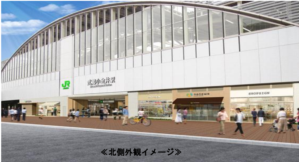
《北側外観イメージ》