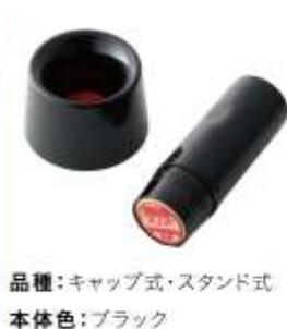
品種：キャップ式・スタンド式 本体色：ブラック