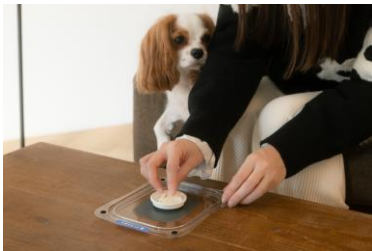
1. フィルムにインキを塗る