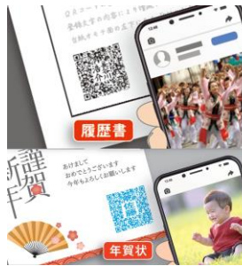
第11回グランプリ受賞 商品名「my QR」

シヤチハタ・ニュープロダクト・デザイン・コンペティション（SNDC）は、商品化を前提に生活や社会を豊かにするプロダクトや仕組みを募集するコンペです。「スーパー楳円はんこ」は、2020年に「これからのしるし」をテーマに行われた第13回SNDCのグランプリ受賞作品になります。2022年の第15回では、「こころを感じるしるし」をテーマに作品を募集し多くのご応募をいただきました。