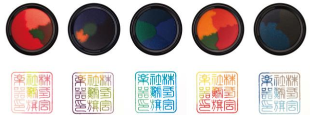
第12回グランプリ受賞 商品名「わたしのいろ」