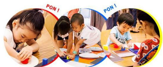
写真には、エポンテ以外の商品も写っています。