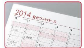
自分コントロールページ