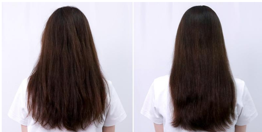
(左) ブラッシングをしていない髪 (右) ザ・アルティメットスタイラーで梳かした髪

特殊構造のブラシにより、梳かすだけでキューティクルを美しく整えます。ブロー後の髪にサッとブラシを通すだけで、髪本来のツヤを引き出し、広がりを抑えてまとまりのある髪に。忙しいお出かけ前のヘアセットにも最適です。