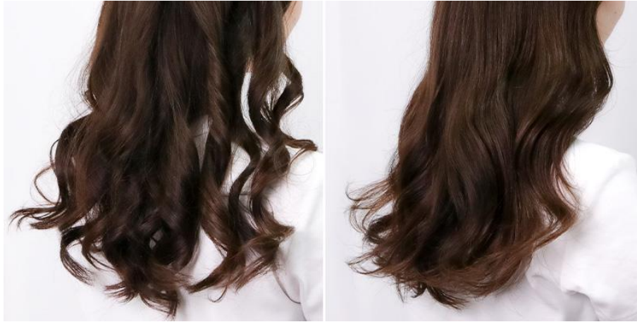
(左) コテで巻いたままの髪 (右) ザ・アルティメットスタイラーでなじませた髪

また、コテやアイロンでくっきり巻いた髪を馴染ませることで、自然で美しく、トレンド感のあるウェーブヘアも簡単に作れます。エクステやウィッグを地毛となじませる時にもお使いいただけます。