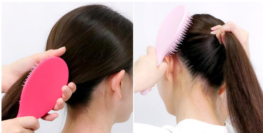
ブラシを通した部分には綺麗なツヤが！お子様のスタイリングにもぴったりです。

歯の先端部分は細く柔軟性があり、髪をとらえる・すくう・馴染ませる、などの細かいニュアンスアレンジも自由自在に調節可能。ポニーテールやお団子ヘアアレンジなどにも活躍します。