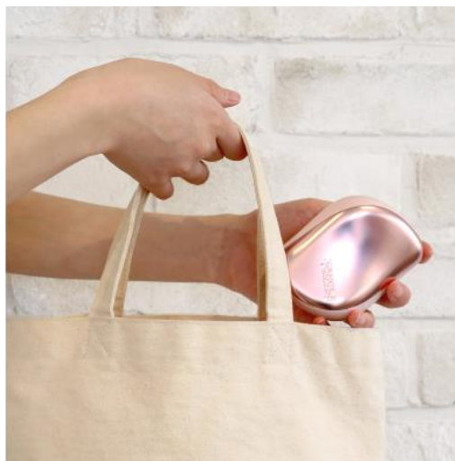
「コンパクトスタイラー」は、持ち歩きにも便利なサイズ感