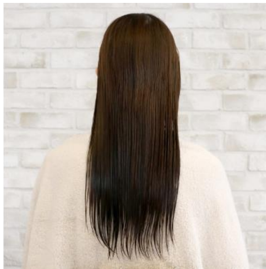
(左) お風呂上り、タオルドライのみ (右) 全体をブラッシング