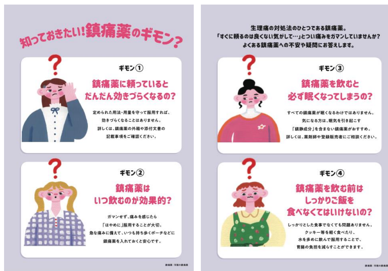
鎮痛薬の疑問にお答えする展示パネル

生理に関連する製品展示エリアでは、生理痛の対処法のひとつとして、解熱鎮痛薬「ロキソニンSプレミアムファイン」を紹介しながら、市販の鎮痛薬に対する疑問にお答えするボードも併せて展示します。