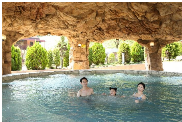
スプリングハウス