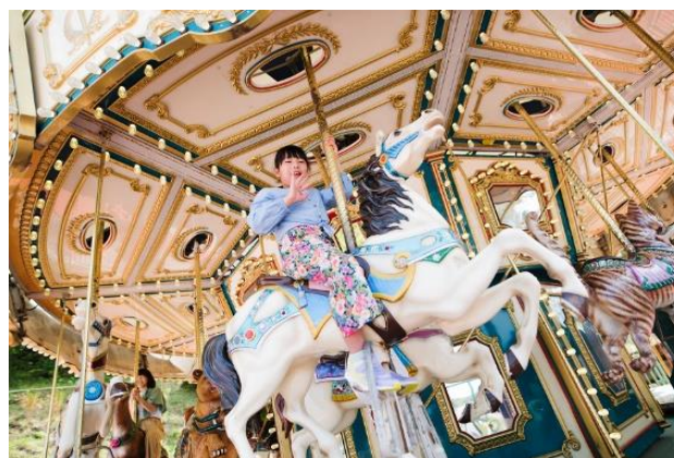
メリーゴーランド