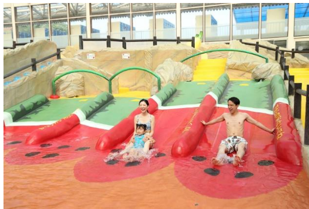
フルーツアイランド