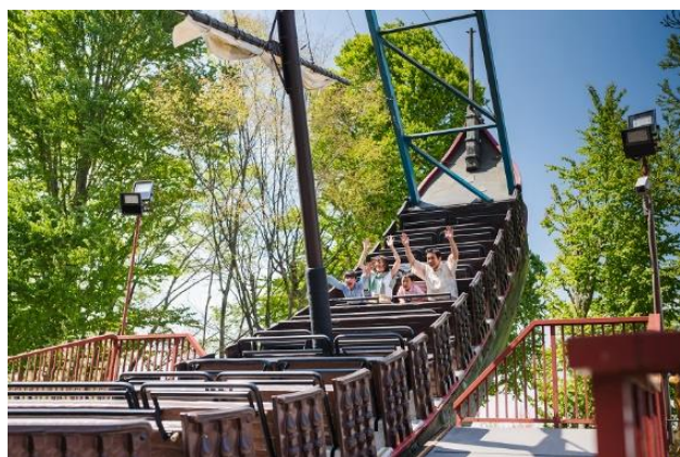
スーパーバウンティ

のんびり系から爽快系まで、定番のアトラクションが充実した自然いっぱいの屋外遊園地エリア。