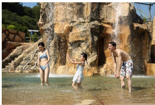
アドベンチャーフォール