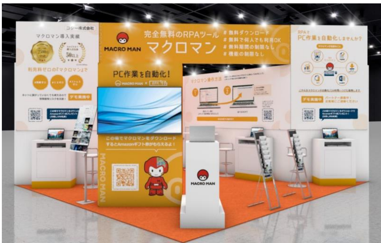
出展ブース(※本画像はイメージであり実際と異なる場合がございます)

当社のブースでは、自治体、官庁、公共機関のDX化や業務効率化の課題に対して、完全無料 RPA ツール「マクロマン(R)」および RPA 導入後の開発・運用・定着までをサポートする「RPA 女子(R)」の展示・ミニセミナー・デモ実演を行い、課題解決を支援いたします。