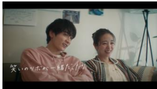
笑いのツボが一緒。 ゆうた「後半の展開弱いね」 まゆう「うん。わかる。」