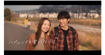
ハプニングも楽しくなったり まゆう「歩いて正解だね」 ゆうた「うん」