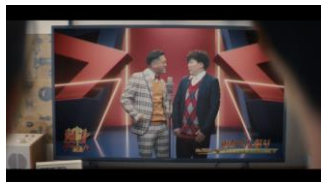
(二人でお笑いを見ている)