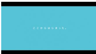
ここからはじまった