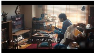
(ゆうたがゲームをして、まゆうが漫画を読んでいる) 別のことをしていても、心地よかったり