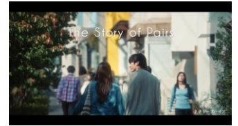
The Story of Pairs