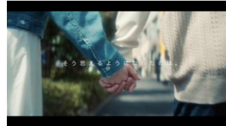
そう思えるようになったのは