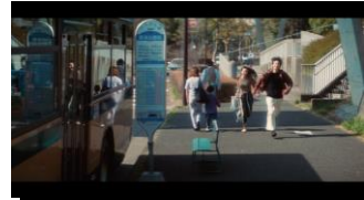
(バスを乗り過ごす) ゆうた「バス行っちゃった！」 まゆう「じゃあ歩きますか！」