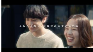
このひととなら、 自分のままでいられる