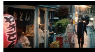
(まゆうの行きつけの居酒屋へ2人で入る) ゆうた「こういう店落ち着けないんだよなあ...」