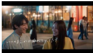
いつのまにか口癖が移って いたり まゆう「博多弁移っとおよ」 ゆうた「え！ははは」