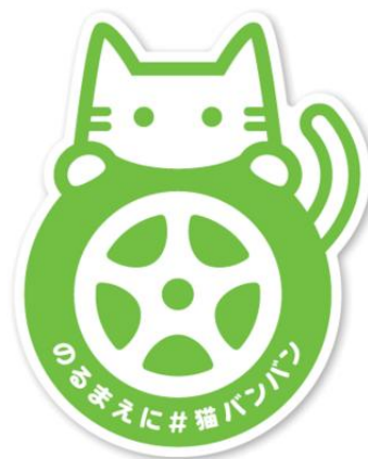
「#猫バンバン」オリジナル マグネットステッカー