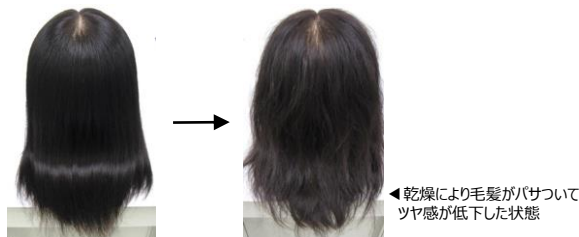
(図2)乾燥による毛髪状態の違い：ホーユー(株)調査

そのため自身の毛髪や頭皮状態を把握し、季節にあったヘアケアアイテムを使い分けをすると良いでしょう。