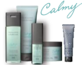
クセを抑えた髪へ導く