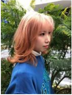
スタイリング/VAICE 浅野様