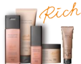
潤いまとまる髪へ導く