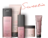
柔らかな髪へ導く