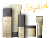
指通りの良い髪へ導く