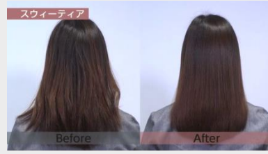
※プロリン、トレオニン、アルギニン、リシン、アラニン、グルタミン酸、グリシン、セリン【毛髪補修】