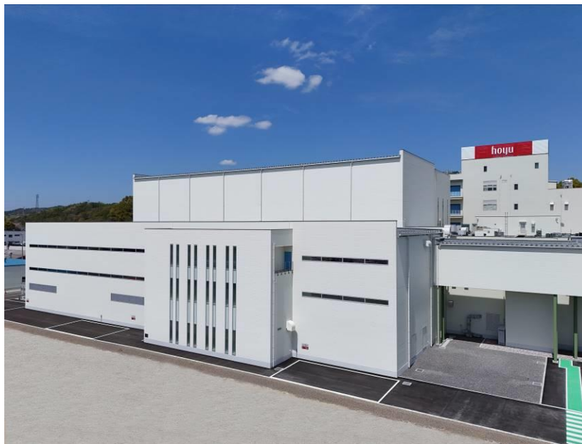
桜が丘工場 第Ⅲ棟 外観