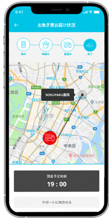
お急ぎ便お届け状況画面