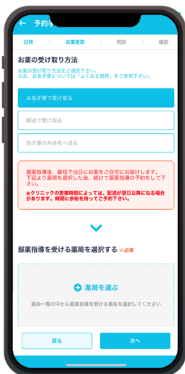
お薬の受け取り方法及び 薬局選択画面