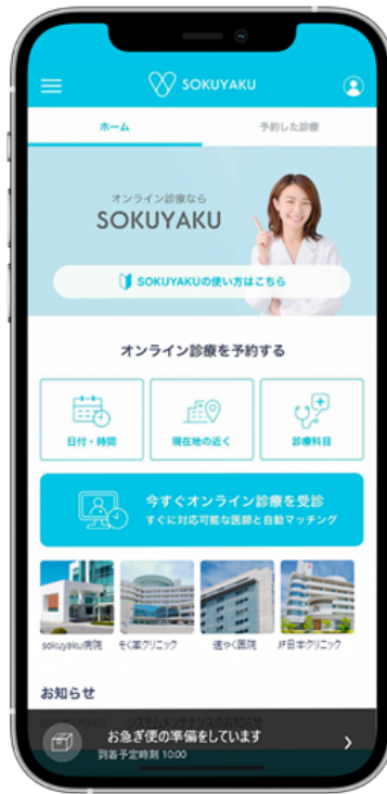
処方薬準備・配送準備にかかる 待機画面