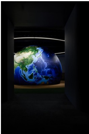
エントランスからのアプローチには宇宙空間が広がる

社内外のコミュニケーションの場として、また社会的・環境的課題解決に取り組むビジネスパートナーとの価値観の共有や、場所提供、そしてものづくりプラットフォームのオープンスペースなど、社内外の共創の場として活用します。