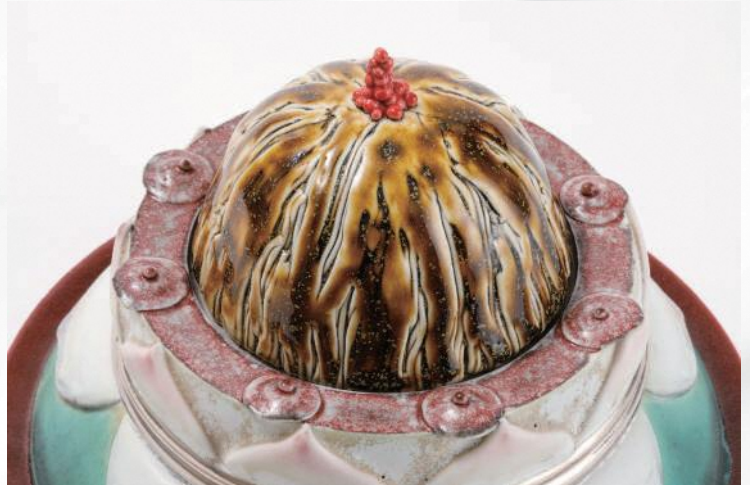
西久松友花《種》2021