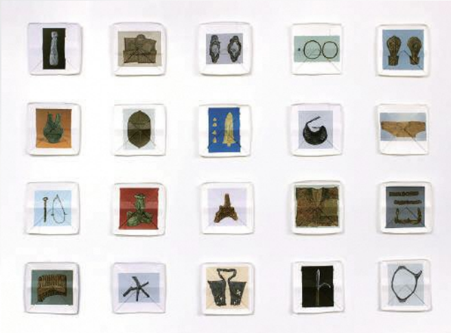
嶋春香《“蒐集”シリーズより》2021