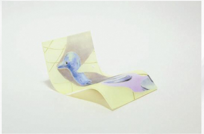
澤あも愛紅《水鳥》2021 | photo by Aki Takayama