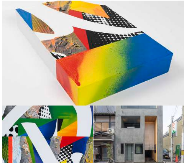
TOP画像 タイトル: combination-quick4(2020) 左) combination-quickII (2020)