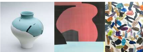
左) 作家名: 野田 ジャスミン タイトル: ghost72 (2020) 中央) 作家名: 武田 論 タイトル: 「存在」の思索における「気配」の考察 (2019) 右) 作家名: 東條 由佳 タイトル: There you are. (2020)