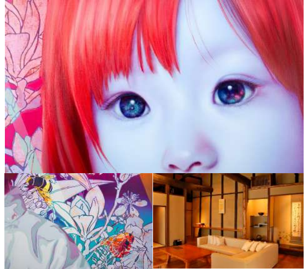
TOP画像・左下ともに タイトル: Spring(部分)(2019) 作品撮影: 堀井ヒロツグ

作品のお問合せ先: 日動コンテンポラリーアート (03-3555-2140 / info@nca-g.com)