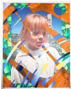
作家名: WHOLE9 タイトル: experiment 4 (2017) 推薦者: Mon Koutaro Ooyama