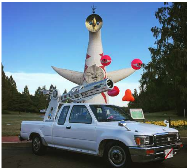
おおさかカンヴァス2016 主催: 大阪府

主催・お問合せ先: ygion / 075-533-8555 / info@ygion.com