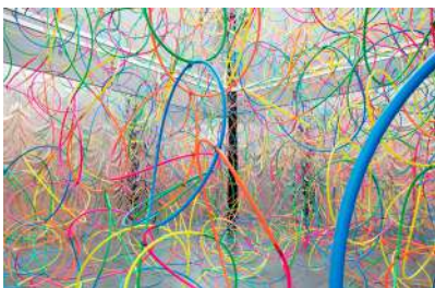
作家名: 鬼頭 健吾 タイトル: untitled (hula-hoop) (2017)