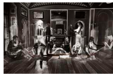
作家名: 佐藤 壮馬 タイトル: 空のピストルケース (2012) サイトスペシフィック パフォーマンス・インスタレーション 公募選出