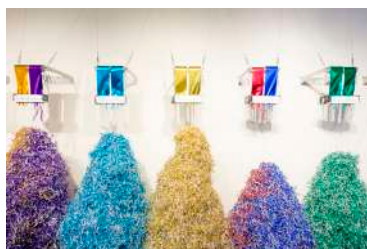
作家名: 油野 愛子 タイトル: viva la vida (2017) 推薦者: 薄久保 香