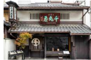
※ 建物を利用したインスタレーションを予定