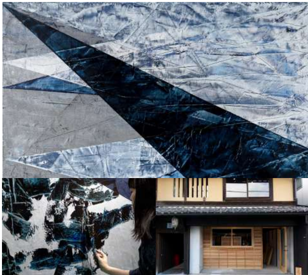
TOP画像 タイトル: 20_4 (2020)《個人蔵》