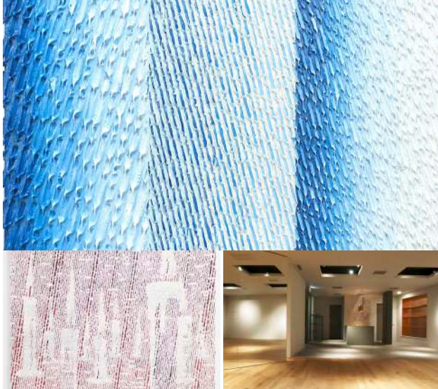
TOP画像タイトル: Moonlight#23(2020) 左下タイトル: Light#10(2019)