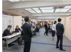
合同企業説明会への出展