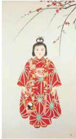
迎春 (昭和20年) 第1回現代美術展覧会 福知山市佐藤太清記念美術館蔵