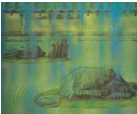
緑雨 (昭和45年) 第2回日展 東京国立近代美術館蔵