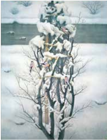
旅の朝 (昭和55年) 第12回日展

平成25年、佐藤太清は生誕100年という記念すべき区切りを迎えました。福知山市佐藤太清記念美術館の所蔵作品、全国的美術館や個人所蔵の作品、また太清の没後に発見され、この度修復を終えた作品や未公開作品を一室にあつめ、画業70年をたどりま。