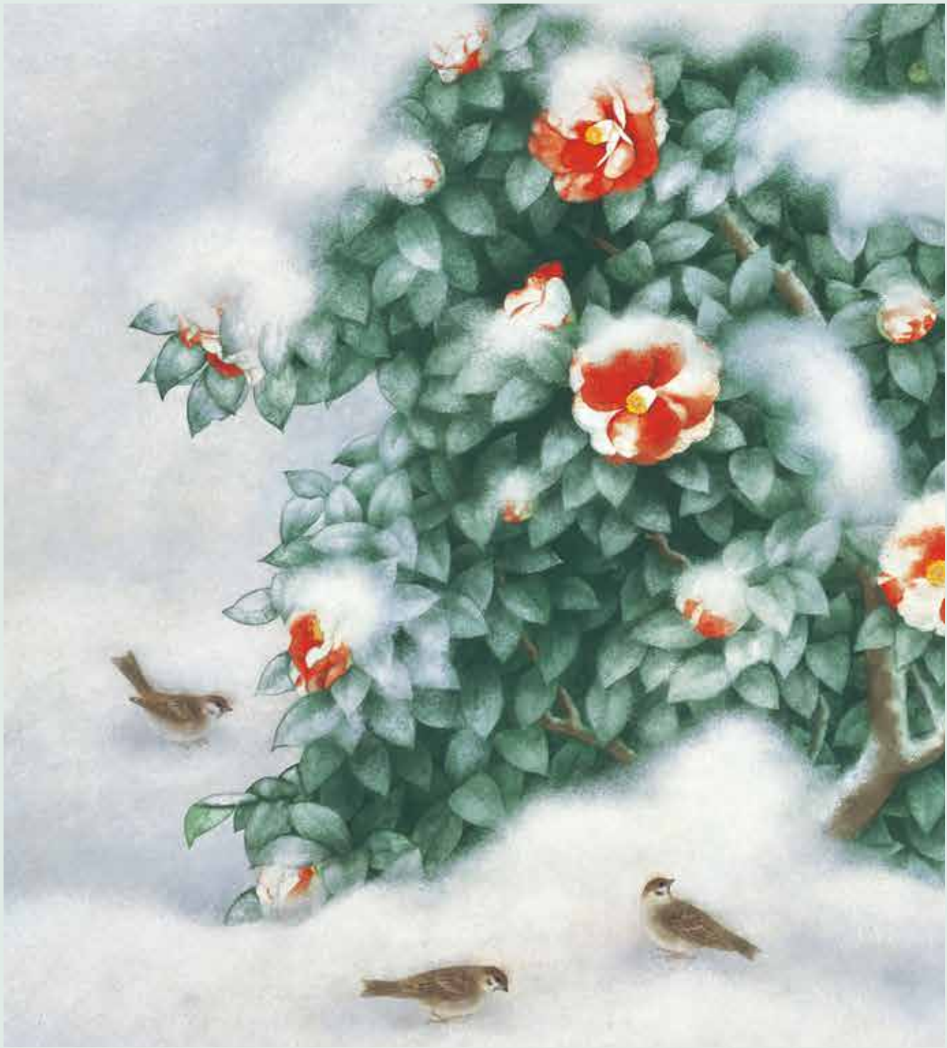
雪つばき[部分] (平成6年) 第26回日展 日本芸術院蔵