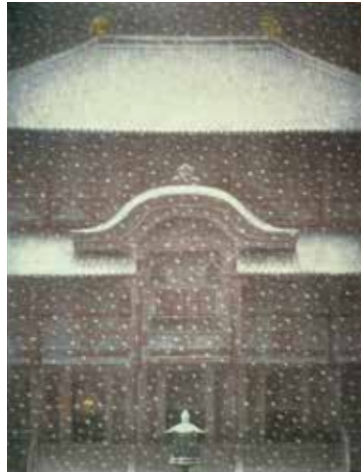
東大寺暮雪 (昭和50年) 第7回日展 広島県立美術館蔵