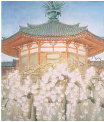
夢殿 (昭和47年) 第4回日展

Commemorating the 100th Anniversary of the Artist's Birth