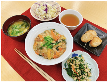
美味しい昼食で午後の仕事もやる気UP