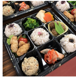
コロナ禍の現在は栄養バランスを考えた弁当を個別に提供