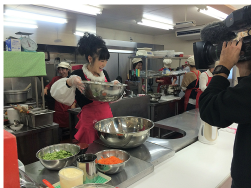
岩本CEOが大切にしている昔ながらの食の教え

お客様に美と健康をお届けしている愛しと一とでは、働く社員が健康であることを最重要課題と捉え、かねてより健康経営に力を入れて参りました。その健康プランとして、全社員の定期健康診断に加え、従業員の健康を考えた栄養バランスのとれた食事を出す社員食堂を、無償で提供することを掲げています。