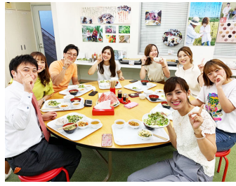
社内交流が花咲く時間♪(通常は円卓でバイキング形式ですがコロナ禍の現在は個室対応)