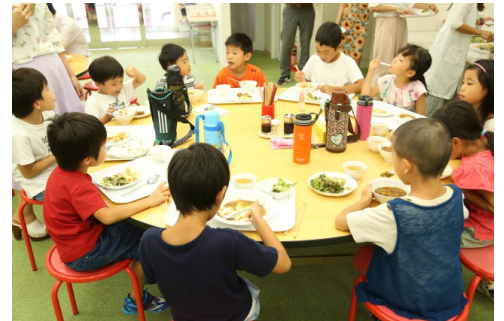
社員食堂で社員の子ども達も和気あいあいと食事を楽しむ(コロナ禍の現在はお弁当で対応中)