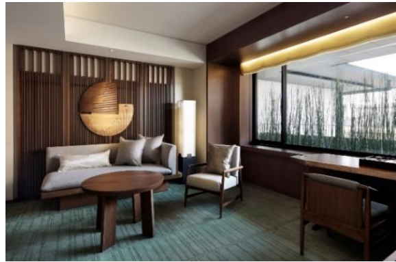
ホテル客室デラックススイート（55 - 65㎡）