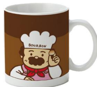
※実際の商品は写真と異なる場合があります。