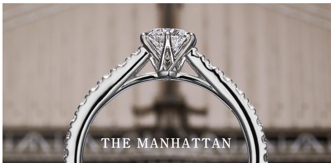
THE MANHATTAN (ザ マンハッタン)

ニューヨークの中心地にかかるマンハッタンブリッジをモチーフにしたエンゲージリング『ザ マンハッタン』は、その高度な建築美を描き出した精巧なデザインに魅了されるリングです。サイドからも目に留まるよう配置されたメレダイヤモンドが、夜景を彩る橋の灯を表現。センターダイヤモンドは透かし窓から光を取り込み、美しく煌びやかな輝きを放ちます。二層構造で造られたマンハッタンブリッジの吊り橋をイメージし、2段に分かれた華やかなアームと6本の爪が交差する美しいサイドビューが特長です。