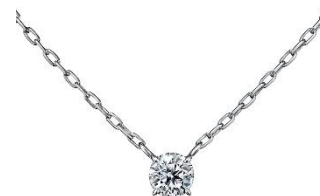
(画像:ダイヤモンドネックレス)