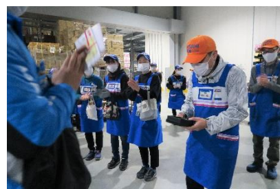
拠点での表彰の様子