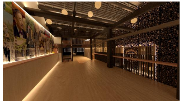
2階「展示の間」：ジンの歴史、蒸溜所 VR ツアー

築100年以上の町家を改装した季の美 House では、「お店の間」や「展示の間」などそれぞれの「間」に「季の美」イズムを散りばめた空間を提供しています。店舗限定商品は1階の「お店の間」のグッズショップで販売しており、2階の「展示の間」ではジンの歴史、蒸溜所のVRツアーやポタニカルを紹介しています。「季の美の間」ではカクテルの他、京都の地酒や地ビール、宇治の玉露、そしてフードメニューには京野菜のおばんざいなどヘルシーフードもご提供いたします。またアメリカの禁酒法時代に人気を博したスピークイージー(アンダーグラウンド酒場)からヒントを得た会員制バー「ジンパレス」では、ビンテージのリキュールを使ったクラシックカクテルをご提供する予定です。レトロな時代にタイムスリップしたかのような異空間で季の美カクテルをご堪能いただけるはずです。