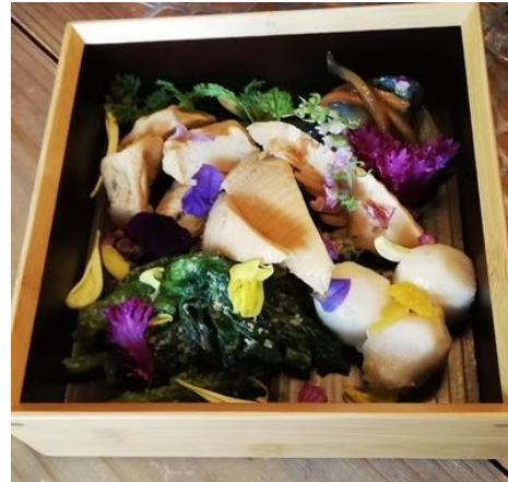
京野菜を使ったヘルシーなフードメニュー

2016 年の創業以来海外の様々な酒類品評会で受賞を重ねてまいりました京都蒸溜所が手掛ける「季の美 House」の概要は、下記をご覧ください。