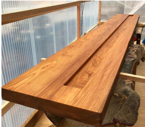
「森の工房 in wood」による檜の手作り家具