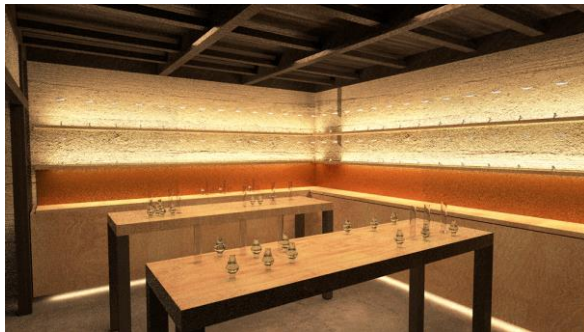
2階「混和の間」：季の美セミナーを実施