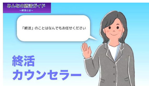
終活のプロ「終活カウンセラー」