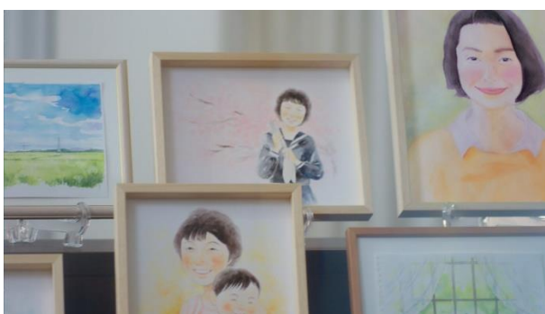
祭壇に飾られていたのは、娘の成長を温かく見守ってきた亡き母が描いた絵