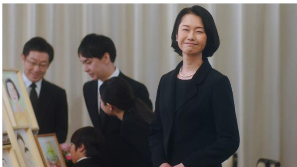
家族で亡き母の思い出を語っていた家族娘は、ずっとよりそってくれた、葬祭ディレクターに清々しい眼差しを送る