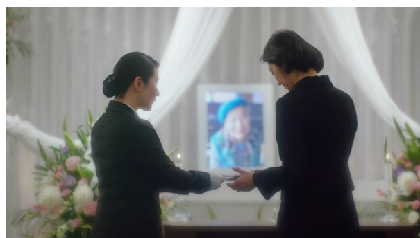
涙ぐむ娘にハンカチを渡す葬祭ディレクター