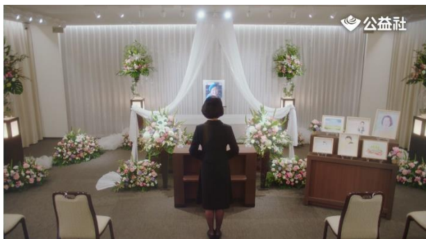
たくさんの絵が飾られている祭壇の前に立つ娘