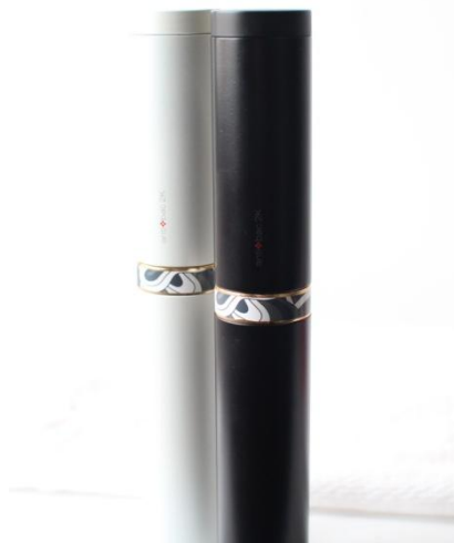
ホワイト(左)/ブラック(右)