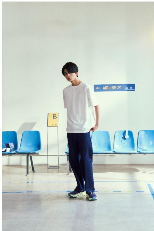
TOPS ¥5,490 (tax in) BOTTOMS ¥8,490 (tax in)