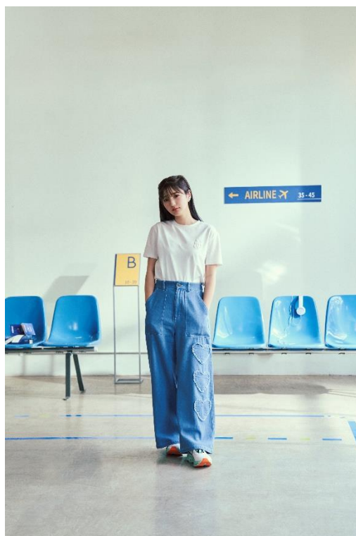
TOPS ¥4,990 (tax in) BOTTOMS ¥8,490 (tax in)