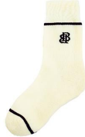
ワンポイントロゴソックス ¥1,200 (tax in)