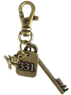
Boka nii Bearキーチャーム ¥2,990 (tax in)