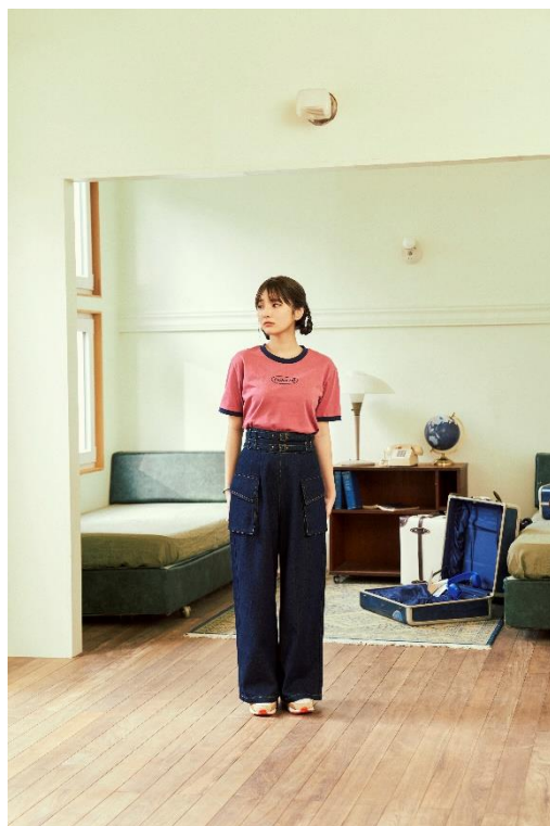
TOPS ¥4,990 (tax in) BOTTOMS ¥7,990 (tax in)