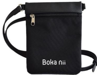
サコッシュ ¥3,490 (tax in)