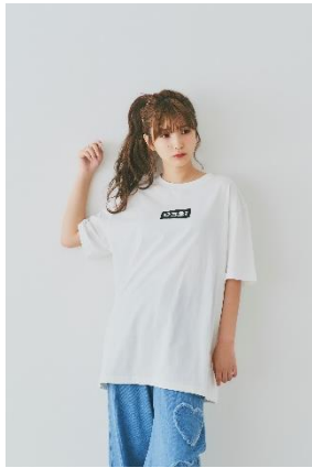
限定Tシャツ ¥4,990 (tax in)