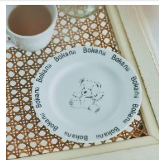
▲ディッシュプレート