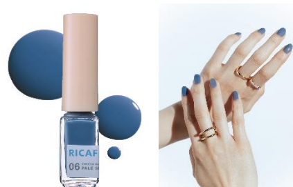
06 ペイルシーライト 深い海に光が差し込んだような 琥珀ブルー