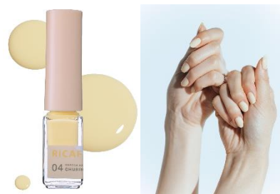
04 チュロスキー チュロスのような優しい甘さの クリームイエロー