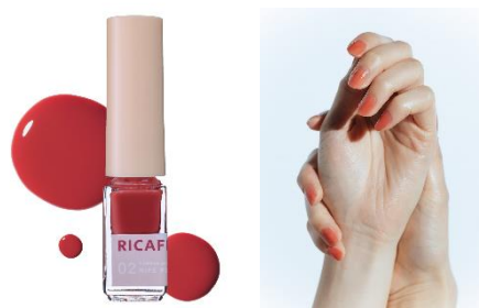
02 ライプピーチミミ 熟した桃のように色めくシアーピンク