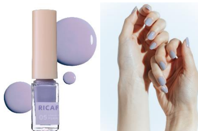
05 パープルフロート とろけるフロートのような パステルパープル