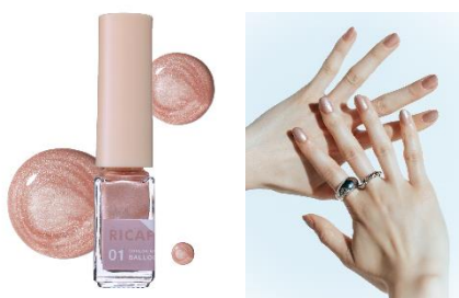
01 バルーンゴールド 心躍るきらめきローズゴールド