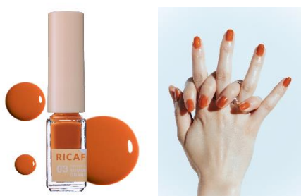
03 サマースコットオレンジ あの夏を思い出す黄昏テラコッタ