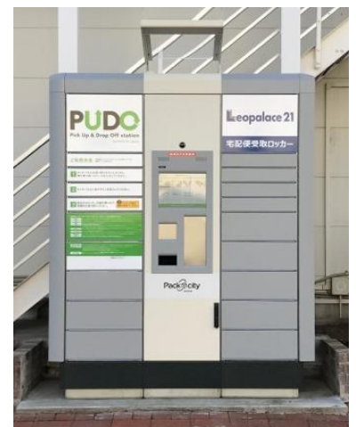
当社管理物件に設置された PUDO ステーション